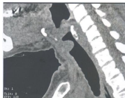
Fig. 1 y 2 Imagen tumoral endoluminal subglótica subcricoidea, pared anterior